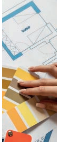
Diseñador de ambientes de casa