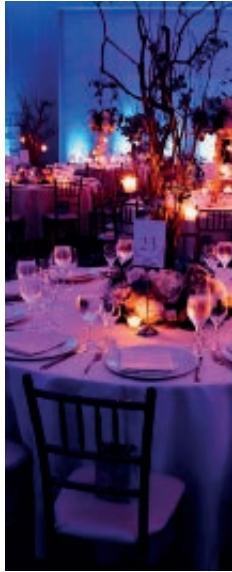
Creativo interiorista para eventos