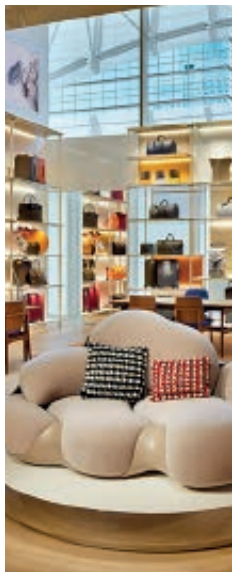
Estilista de interiores para tiendas de retail