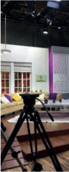
Diseñador de sets