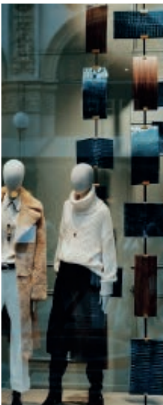
Diseñador de exhibiciones